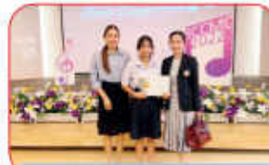
รางวัลขับร้องเพลงไทยเดิม BCCMO 2022