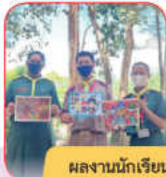
ผลงานนักเรียน ด้านทัศนศิลป์