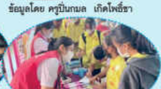
ข้อมูลโดย ครูปิ่นกมล เกิดโพธิ์ธา