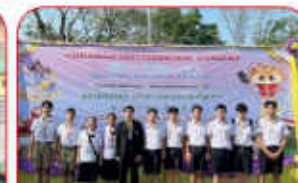
ศิลปหัตถกรรมนักเรียน กิจกรรมวงดนตรีลูกทุ่ง ระดับม.ต้น และม.ปลาย จารุภัทรวิทยุเงิน