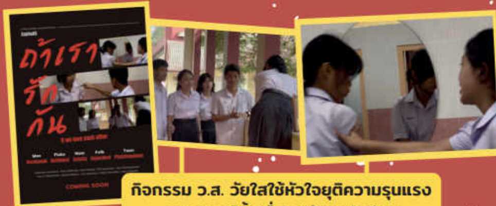
กิจกรรม ว.ส. วยไซใช้หัวใจยุติความรุนแรง ภาพยนตร์สั้นเรื่อง "ถ้าเรารักกัน"