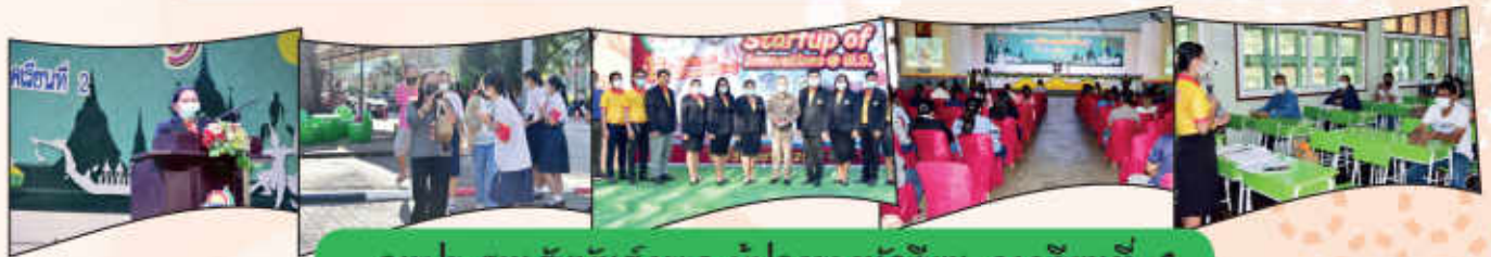
การประสานสัมพันธ์ครูและผู้ปกครองนักเรียน ภาคเรียนที่ 2