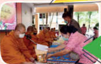
กิจกรรมทันตกรรม ต้อนรับปีใหม่ 2566