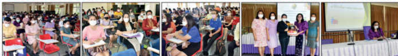
กิจกรรมการอบรมเชิงปฏิบัติการด้านการเงินและพัสดุโรงเรียน ในวันที่ 8 ตุลาคม 2565 ณ ห้องสมุด 3 โรงเรียนแก่ง"วิทยสดาวาร"