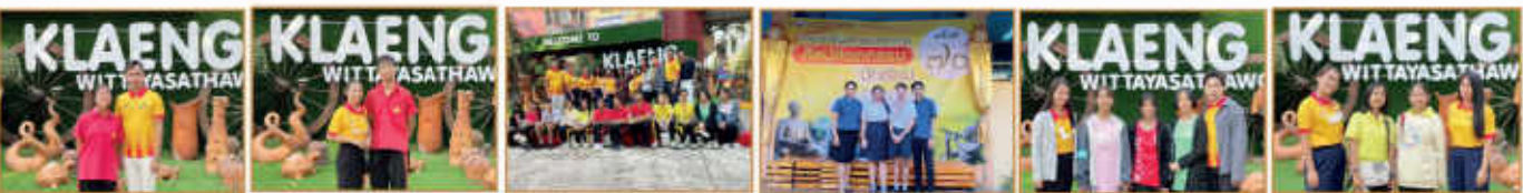
กิจกรรมส่งนักเรียนเข้าแข่งขัน งานศิลปหัตถกรรมนักเรียน ระดับชาติ ภาคกลางและภาคตะวันออก ครั้งที่ 70 ปีการศึกษา 2565 ณ จังหวัดราชบุรี ระหว่างวันที่ 25 - 27 มกราคม 2566