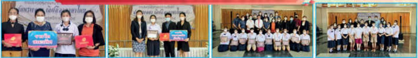
การประกวดสุนทรพจน์ ระดับประเทศ “สุนทรพจนาลีคลีภาษาไทยครั้งที่ 2” วันที่ 17 พฤศจิกายน 2565 ณ โรงเรียนแก่ง“วิทยสดาวาร”