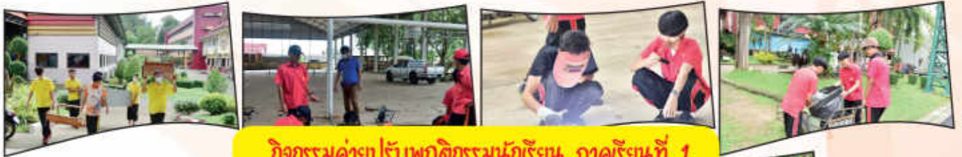
กิจกรรมค่ายปรับพฤติกรรมนักเรียน ภาคเรียนที่ 1