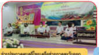
ร่วมประกวดดนตรีไทยเครื่องสายภาคตะวันออก ณ จร.วัดโศภนารามวรวิหาร