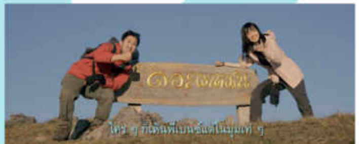
Pigkaploy X Gaijin Road trip เชียงราย ซามแดน ไทย-ลาว