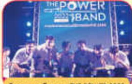
กิจกรรมดนตรีจาก THE POWER 2022 BAND SEASON 2