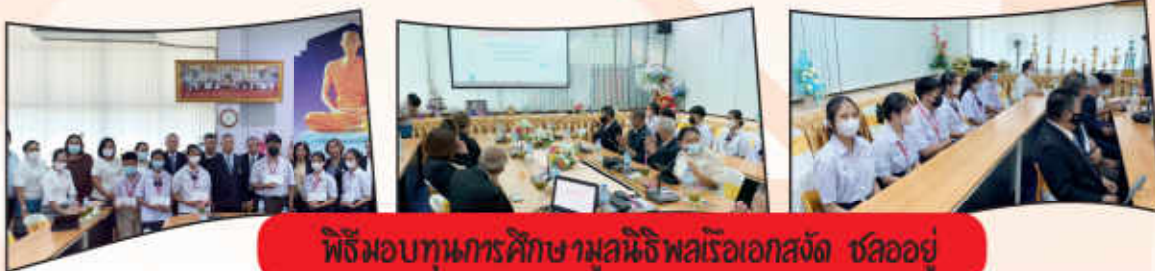
พิธีมอบทุนการศึกษามูลนิธิพลเรือเอกสัจด์ ชลออยู่