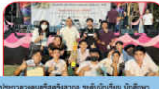
ประกวดดนตรีสร้างภาค ระดับนักเรียน นักศึกษา แลอยุธยา ณ มหาวิทยาลัยราชภัฏรำไพพรรณี