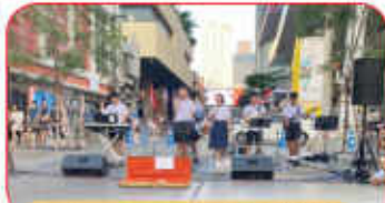
การประกวดดนตรีสากลประจำปี 2565 จอมคิดเลือกสนามชลบุรี