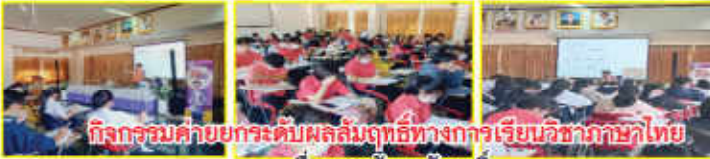
กิจกรรมค่ายยกระดับผลสัมฤทธิ์ทางการเรียนวิชาภาษาไทย