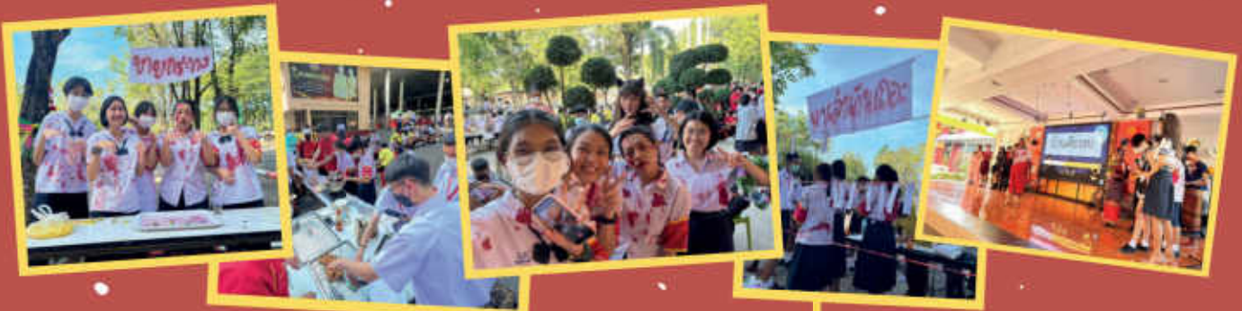
กิจกรรมวันฮาโลวีนน้อยลอยทะเล