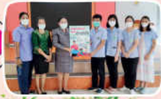
กิจกรรมก้าวหัวใจ รวมกัน โรงพยาบาลแก่ง