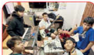
การฝึกซ้อมวงดนตรีสตริง