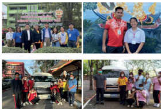
ตารางสรุปกิจกรรมการแข่งขันศิลปหัตถกรรมนักเรียน ระดับชาติ ภาคกลางและภาคตะวันออก ครั้งที่ 70 ปีการศึกษา 2565