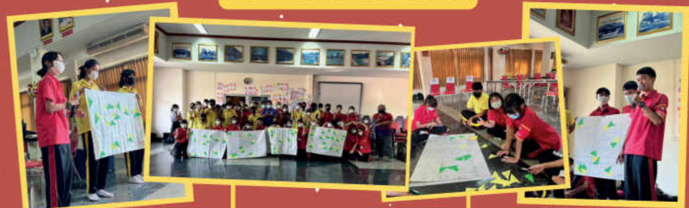
เข้าร่วมอบรมโครงการ ซีโรเทควันโตเพื่อยุติการรังแก