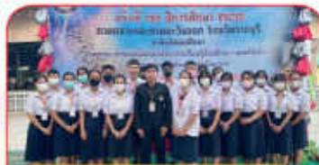
ศิลปหัตถกรรมนักเรียน กิจกรรมขับขานประสานเสียง ระดับม.ปลาย จารุภัทรวิทยุเงิน ปีที่ 11