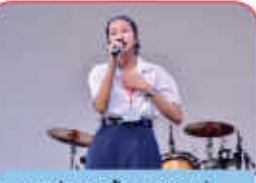
การประกวดร้องเพลงลูกทุ่ง งานศิลปหัตถกรรมนักเรียน