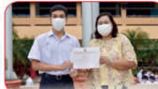
มอบรางวัลนักเรียนร่วมกิจกรรมขับร้อง