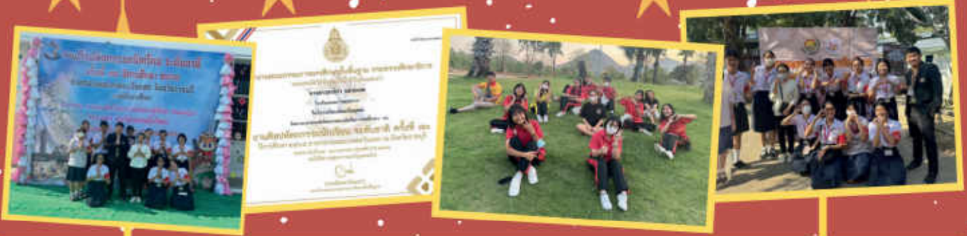
กิจกรรมการแข่งขันสภานักเรียน ระดับชั้น ม.1-ม.6 งานศิลปหัตถกรรมนักเรียนระดับชาติครั้งที่ 70