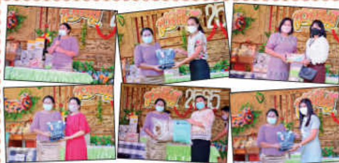
กิจกรรมสวัสดิ์ปีใหม่ 2566

อบรมการออกแบบกิจกรรมการเรียนรู้ให้ตอบใจวัย 8 ตัวชี้วัด เพื่อขอมิและ/หรือเลื่อนวิทยฐานะของข้าราชการครูและบุคลากรทางการศึกษาคำแหน่งครู ตามเกณฑ์ ว 9/2564 จัดโดย สหวิทยเขต 2 ในวันที่ 21 สิงหาคม 2565 ณ หอประชุมโรงเรียน มกุฏเมืองราชวิทยาลัย