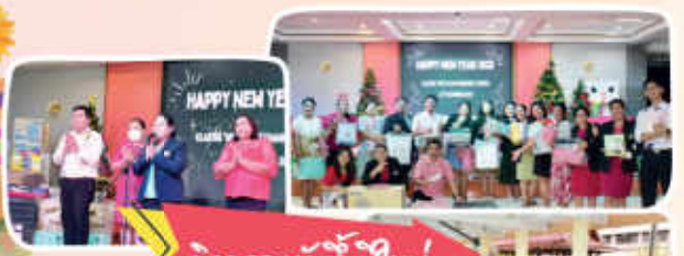
กิจกรรมวันปีใหม่