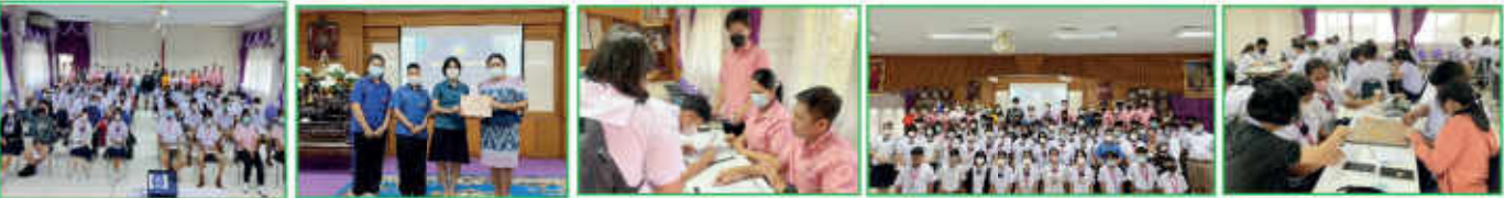
กิจกรรม “ค่ายคำคม” สำหรับนักเรียนที่มีความถนัด ความสนใจ มุ่งเน้นให้ผู้เรียนมีทักษะ การอ่าน การเขียน การสื่อสาร การคิดคำนวณต่อคำคม รุ้แพ้รู้ชนะและเกิดจิตสำนึกในการอนุรักษ์ภาษาไทย เมื่อวันที่ 17 มกราคม 2566 ณ โรงเรียนแก่ง“วิทยสดาวาร”

เพื่ออนุรักษ์วัฒนธรรมไทย สืบสานความเป็นไทย และตระหนักในคุณค่าความสำคัญของภาษาไทย