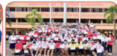
นักเรียนร่วมกิจกรรม ศิลปหัตถกรรม ระดับมหาวิทยาลัย