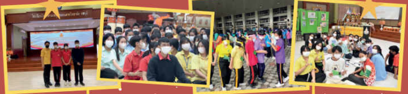
เข้าร่วมโครงการเสริมสร้างความปลอดภัยในสถานศึกษา ณ โรงเรียนวิทยาศาสตร์จุฬาภรณราชวิทยาลัย ชลบุรี