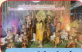
การแสดงนาฏศิลป์ งานวันสมเด็จพระเจ้าตากสินมหาราช อำเภอแกลง