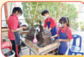
การฝึกซ้อมนักเรียนที่มีทักษะ ด้านศิลปะ