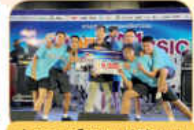
ประกวดดนตรีเยาวชน "MPR Music Contest 2022 ครั้งที่ 10" ณ Rayong