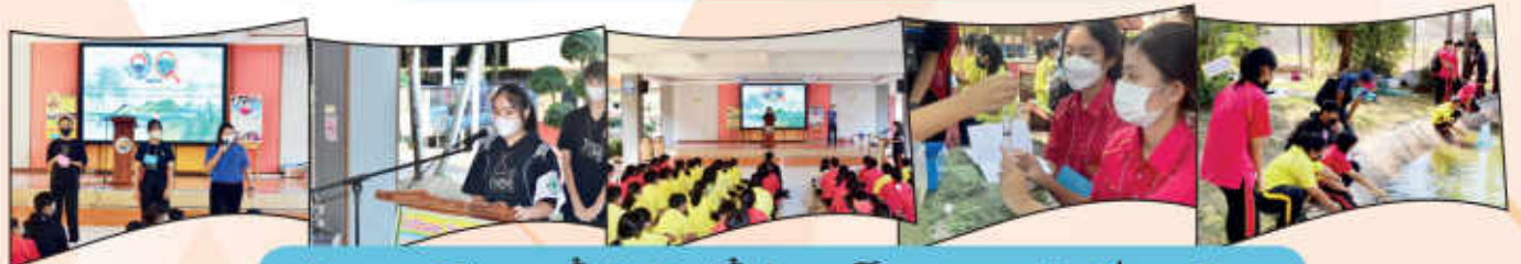
กิจกรรมนักษิณสาขาน้ำ รักษ์แม่ฟ้าประเส โครงการ ว.ส.รักษ์สิงห์เขตลุ่ม