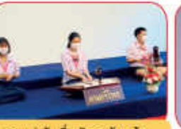
การแข่งขันเดี่ยวขับ จะด้นม ด้นงานศิลปหัตถกรรม ระดับมหาวิทยาลัย