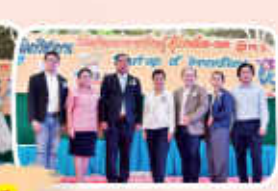
เปิดบ้านเลื่อง-แดง ร่วมกัน ตระกานศึกษาาสตร์ อพว.