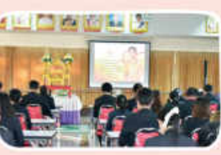
กิจกรรมสวดมนต์ ถวายพระพรซึ่งมงคล สมเด็จพระเจ้าลูกเธอ เจ้าฟ้าพัชรกิติยาภา นเรนทรภาทพงษวดี กรมหลวงราชสารินสิริวิสุทธิ ชนาวังราชธิดา