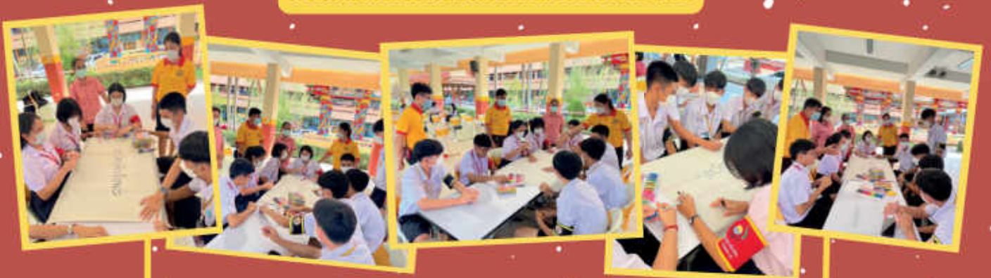
บันทึกข้อตกลงความร่วมมือ โครงการสถานศึกษาสีขาวปลอดยาเสพติดและอบายมุข