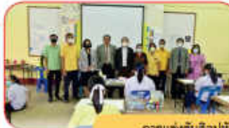
การแข่งขันศิลปหัตถกรรมนักเรียน กลุ่มสาระการเรียนรู้ศิลปะ ด้านทัศนศิลป์