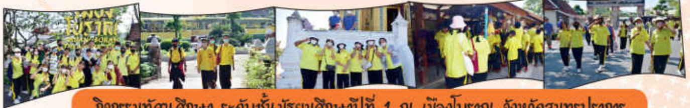
กิจกรรมทัศนศึกษา ระดับชั้นมัธยมศึกษาปีที่ 1 ณ เมืองโบราณ จังหวัดสมุทรปราการ