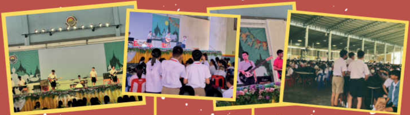
กิจกรรมดนตรีนั้นคือชีวิตครั้งที่ 1