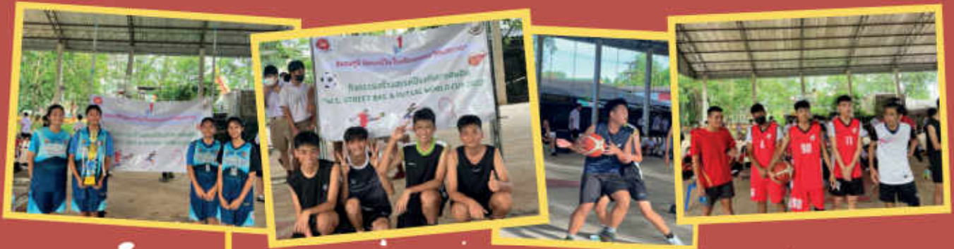
กิจกรรมสร้างสรรค์ป้องกันยาเสพติด "W.S. STREET BAS & FUTSAL WORLD CUP 2022"